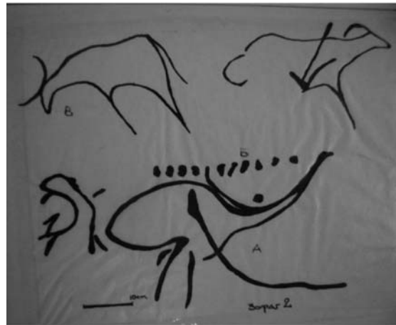
Ховд аймгийн Манхан сумын Хойд цэнхэрийн агуйн зосон зураг /Дээд палеолитийн МЭӨ 40000 жил/