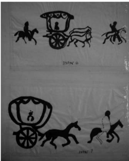
Ховд аймгийн Алтай сумын Ямаан усны хадны сүйхний зураг /Хүннүгийн үе/