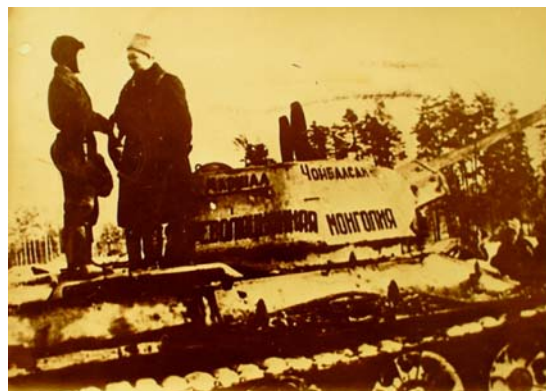
Маршал Х.Чойбалсан Хувьсгалт Монгол танкийн бригадыг зөвлөлтийн дайчдад гардуулж байгаа нь. 1943 он