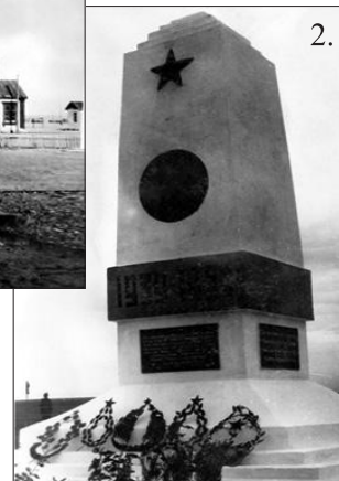
1. Манлай баатар Дамдинсүрэнгийн хөшөө