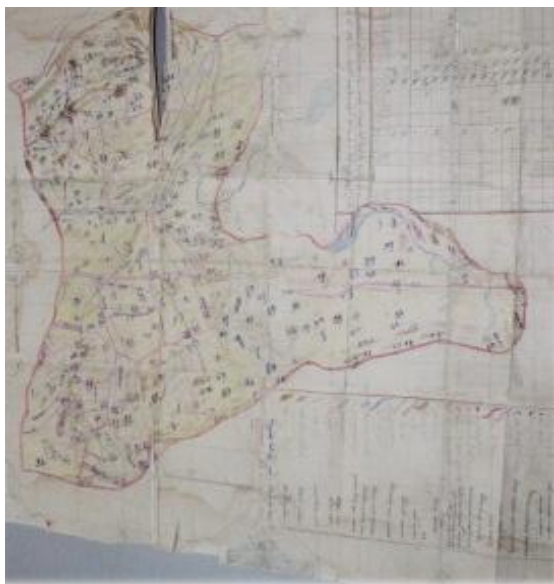
Сэцэн хан аймгийн нутаг дэвсгэрийн гар зураг

улсын Их цааз хуулийн төсөлд өгсөн саналууд, Монгол улсын төр нийгмийн зүтгэлтэн маршал Х.Чойбалсангийн мэндэлсний 100 жилийн ойн, То-Вангийн мэндэлсний 200 жилийн ойн мөн Ардын ерөөлч Ч.Жигмэдийн мэндэлсний 100 жилийн ойн баримтууд, аймгийн Бүтээлийн ундрага, Оюуны ундрага шагнал бий болгох тухай ИТХ-ын тогтоол, танилцуулга, Дорнод аймгийн түүхэнд холбогдох баримтуудыг түүвэрлэн авсан баримтууд зэрэг аймгийн түүхэн ач холбогдолтой үнэт баримтууд хадгалагдаж байна.