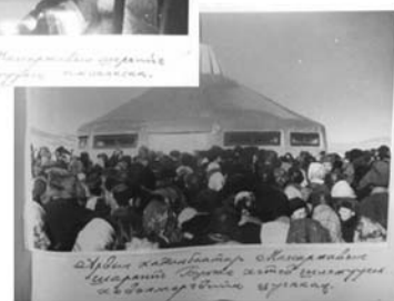
Хатан баатар Магсаржавын шарилыг шилжүүлэн оршуулах ёслол. 1970 он