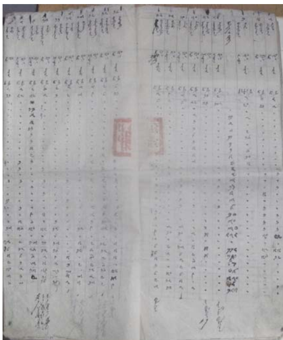
Сайхан сумын мал тооллогын 1920 оны бүртгэл

Булган аймгийн архивт төрийн 249, төрийн өмч оролцсон аж ахуйн нэгжийн 8, улс төрийн намын 32, олон нийтийн 2, Төрийн бус байгууллагын 4, хувийн хэвшлийн аж ахуйн нэгжийн 47, хувь хүний 9 хөмрөгөөс бүрдсэн удирдлагын болон эрдэм шинжилгээ, лавлагааны нийлсэн 1920-2010 оны Ардын засгаас Ардчиллын үеийн 20187 баримт хадгалагдаж байна.