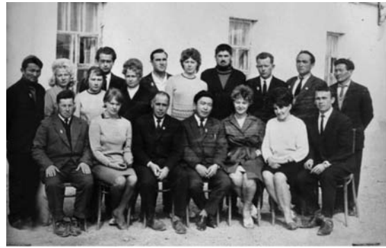
СЭВ-ийн орнуудын гишүүн ЗХУ-аас Мал аж ахуйн салбард ирж ажилласан мэргэжилтэнүүд 1967 он 09 дүгээр сарын 05