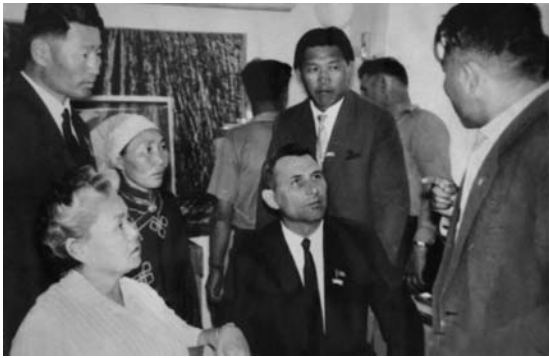
СЭВ-ийн орнуудын гишүүн Чех улсын тусламжтайгаар 1963 онд манай аймагт радио холбооны станц баригдсан.